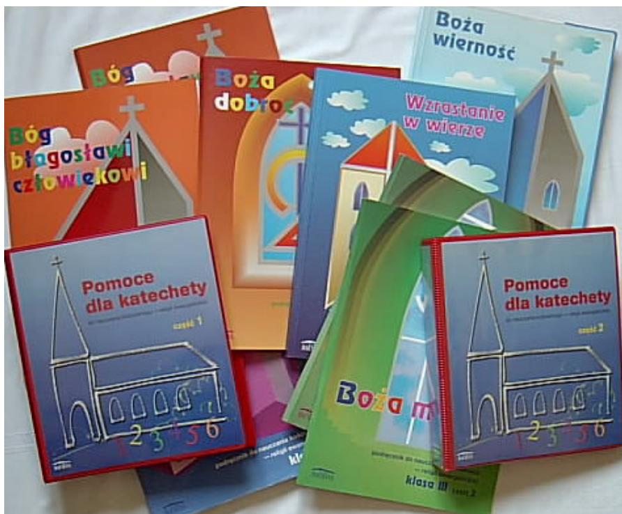
Zdjęcie nr 3: Podręczniki i przewodniki metodyczne programu RSP – 1/99/a,b,c,d,e,f.